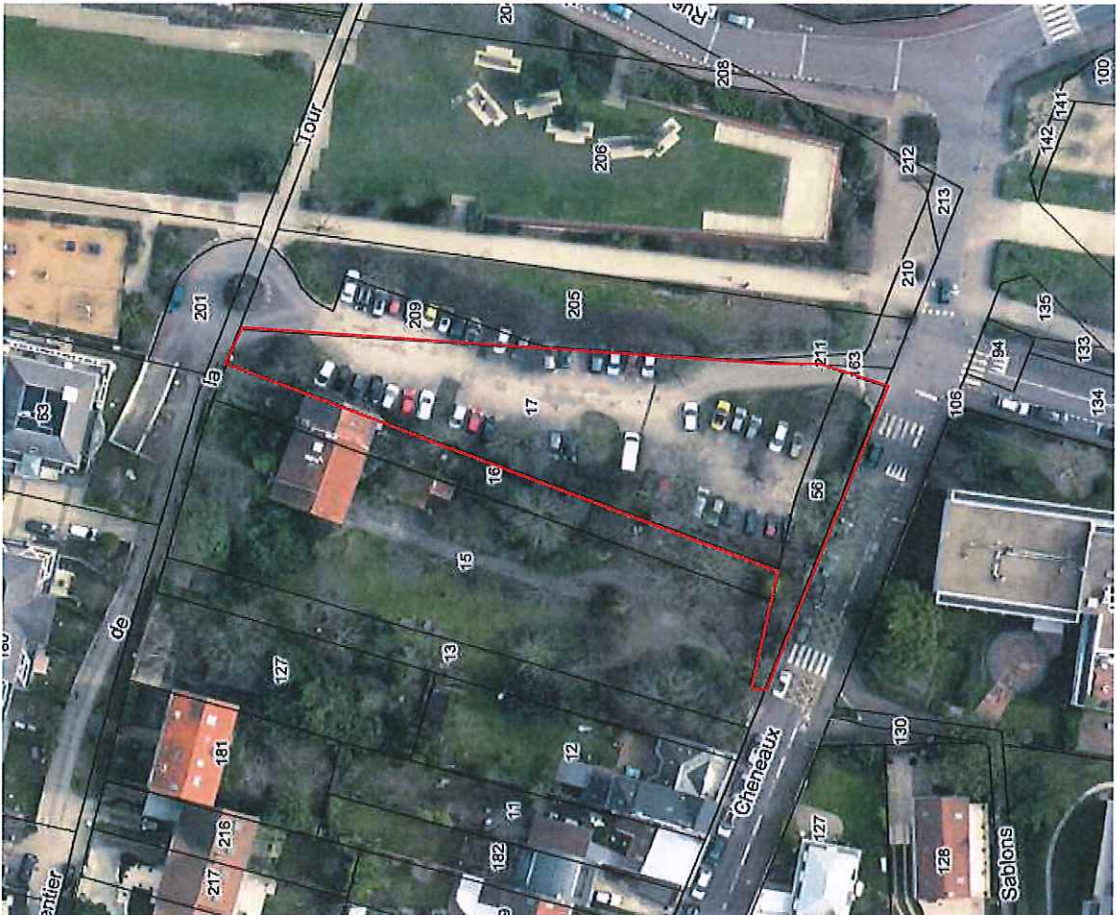
Extrait du plan cadastral – parcelles section E n°17 et 56